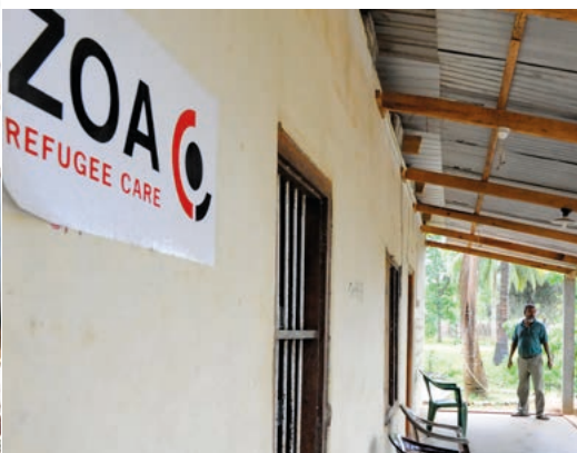
'Wij kochten boten en hielpen vissers hun angst te overwinnen'

toekomstgericht gebleven: wat is nú belangrijk met het oog op een volgende fase? Ook steken we het liefst in op integrale noodhulp, dus we investeren het liefst meteen in onderwijs, infrastructuur, onderdak, het (her)opzetten van bedrijfjes en het faciliteren van vredesgesprekken. Je legt als het ware meteen het fundament voor wederopbouw."