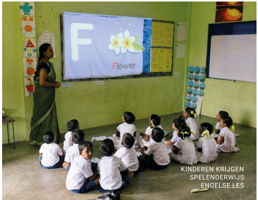
KINDEREN KRIJGEN SPELENDWIJS ENGELSE LES

"Er was een gemeenschappelijke visie om te werken aan de ontwikkeling van het