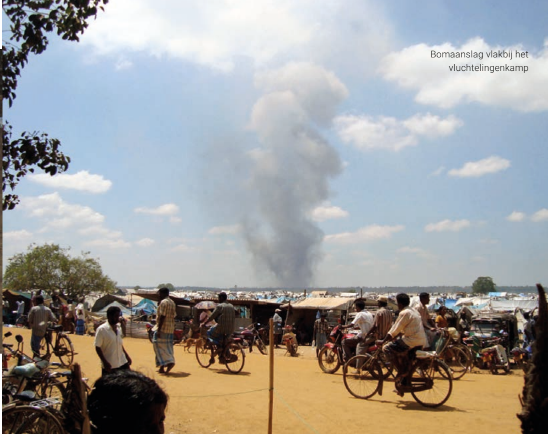
Bomaanslag vlakbij het vluchtelingenkamp

doen. Gelukkig kon ik dit wel delen met mensen van ZOA.”