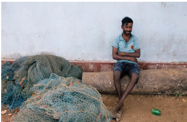
Een visser geniet van zijn pauze