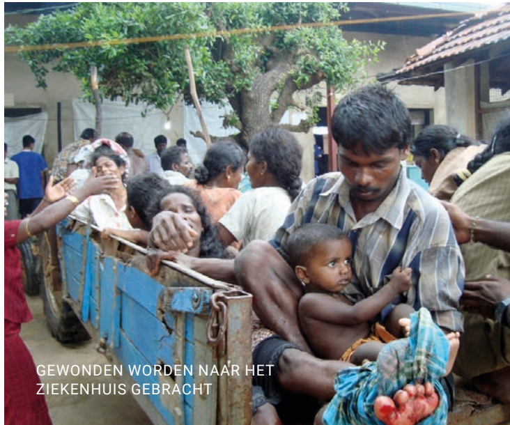
GEWONDEN WORDEN NAAR HET ZIEKENHUIS GEBRACHT